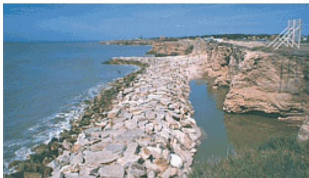
Impacto negativo por el mal manejo de áreas costeras

Es urgente intervenir en las amplias áreas rurales, en particular del litoral costero afectado por el turismo balneario. Los fenómenos ya descritos han ocasionado fuertes impactos negativos sobre los roles y funciones que la producción agropecuaria asignó históricamente a esas zonas y con ello han generado una tendencia de crisis en la sustentabilidad de los ecosistemas en su conjunto.