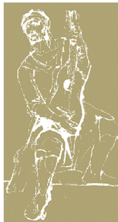
© Martín Fierro con dibujos de Castagnino. Editorial Universitaria de Buenos Aires

Todos los personajes presentados, además de otros notables escritores del XIX como Hilario Ascasubi (1807 - 1875); Lucio V. Mansilla (1831-1913); José Hernández (1834-1886); Estanislao del Campo (1835-1880), Ricardo Güiraldes (1886-1927) y aquellos que les siguen y sus ilustradores son testigos de su tiempo. Los paisajes en los cuales se desarrolla la epopeya gauchesca y su ricadiversidad biológica y cultural han sido crecientemente amenazados por un productivismo exacerbado. Corresponde ahora considerarlos como un patrimonio identitario al cual se aplique el principio de un desarrollo sostenible ecológicamente sano, socialmente equitativo, culturalmente apropiado y económicamente responsable.