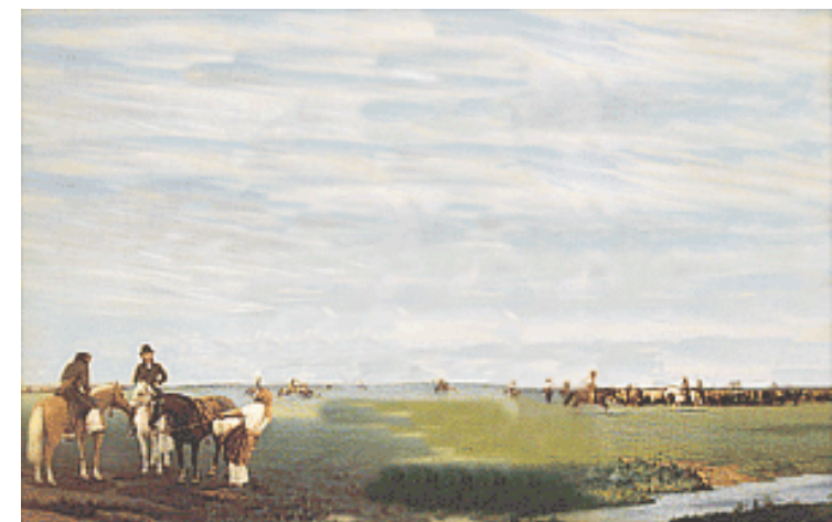
El rodeo. Oleo de Prilidiano Pueyrredon, 1861. Museo Nacional de Bellas Artes, Buenos Aires

Charles Darwin, famoso y controversial naturalista inglés (1809-1882), visita en 1832 el Uruguay y la Argentina en su famoso viaje de exploración en el navío Beagle. Sus relatos contienen valiosas observaciones científicas y descripciones detalladas de tipos sociales que incluyen los gauchos, para quienes muestra una extraña dicotomía de opinión. De manera mucho más afectiva y nostálgica, Guillermo Enrique Hudson (Quilmes, 1841- Londres, 1922) en su conocido libro “Allá lejos y hace tiempo” (1918), ha emocionado a varias generaciones de jóvenes lectores con sus recuerdos de la pampa, su naturaleza y sus gauchos que tanto le enseñaran.