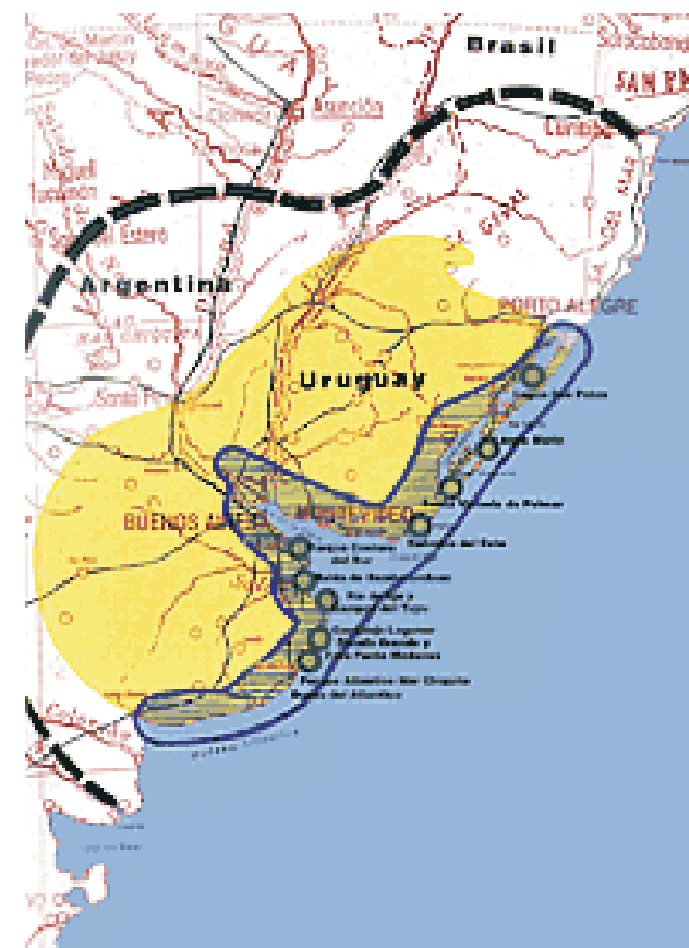
Red de áreas naturales protegidas. Las rutas de los troperos de antaño configuran un gigantesco "Camino del Gaucho" que entrelaza estas áreas naturales y cientos de sitios culturales existentes.

La recuperación de esa cultura configura una gran oportunidad de tipo múltiple para enfrentar los impactos antes descritos, por sus valores intrínsecos y de manejo del medio natural. Con sus grandes atractivos de turismo rural y cultural, y sus potencialidades para recuperar el rol y la función del medio rural y los pequeños asentamientos para un desarrollo sustentable, ofrece una ocasión de cambio hacia un desarrollo más inclusivo y equilibrado.